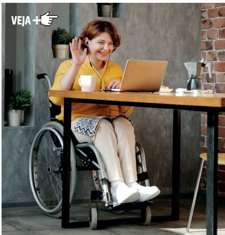
4 - Imaculada em revista

Rezemos para que as pessoas portadoras de deficiência estejam no centro de atenção das sociedades, e as instituições promovam programas de inclusão que valorizem a sua participação ativa.